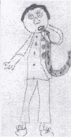
Rémi LEHONARDT au saxophone